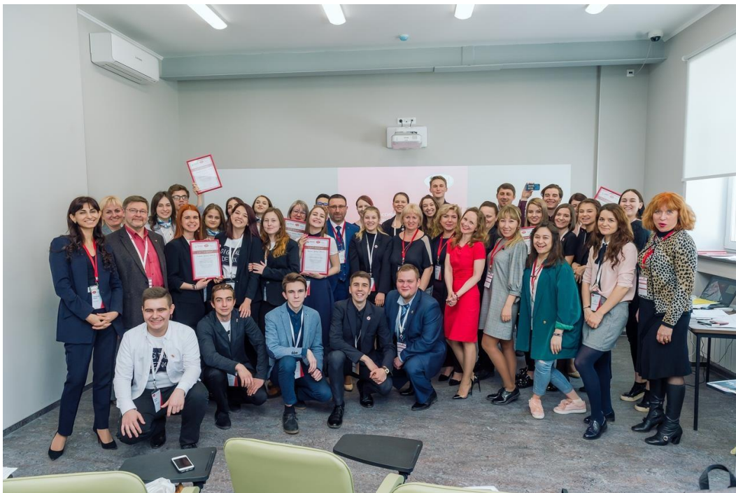
Рисунок 4 – Всероссийский акселератор социальных инициатив «RAISE» 2019