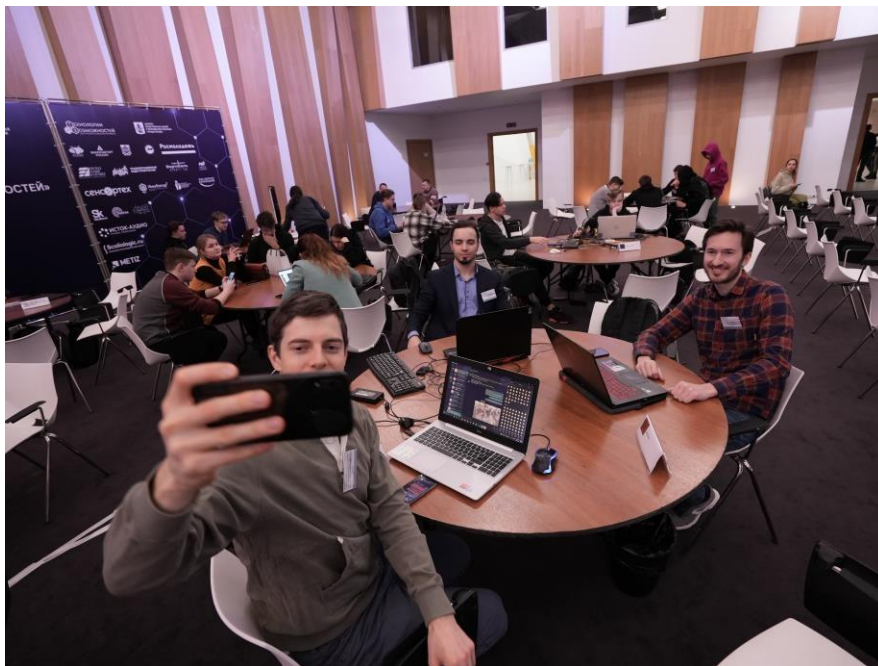
Рисунок 5 – Хакатон «Технологии Возможностей» 2021

Описанные мероприятия направлены на развитие профессионального сообщества и популяризацию направления Национальной технологической инициативы, создание инфраструктуры постоянного присутствия участников отдельного направления Национальной технологической инициативы на целевых зарубежных рынках, расширение и активизацию работы научного сообщества для формирования и реализации передового научно-технического задела, в том числе путем проведения научных и образовательных конференций (в рамках указанных мероприятий), содействия созданию (поддержке) международных журналов научно-технических проблем, содействию и поддержке образовательных проектов и программ молодежного инженерного творчества.