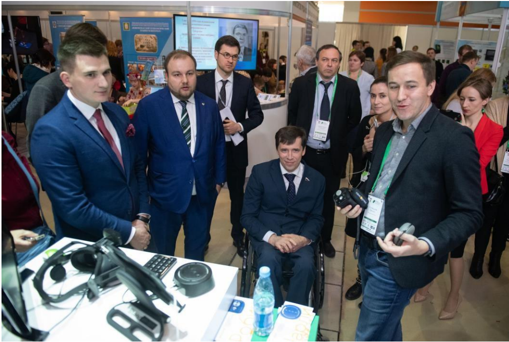
Рисунок 3 – Национальный форум реабилитационной индустрии «Надежда на технологии» 2019