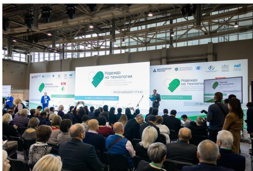
Рисунок 2 – Национальный форум реабилитационной индустрии «Надежда на технологии» 2019