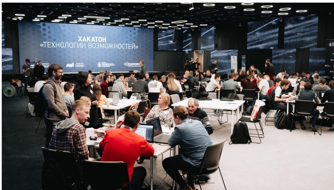
Рисунок 1 – Хакатон «Технологии Возможностей» 2019