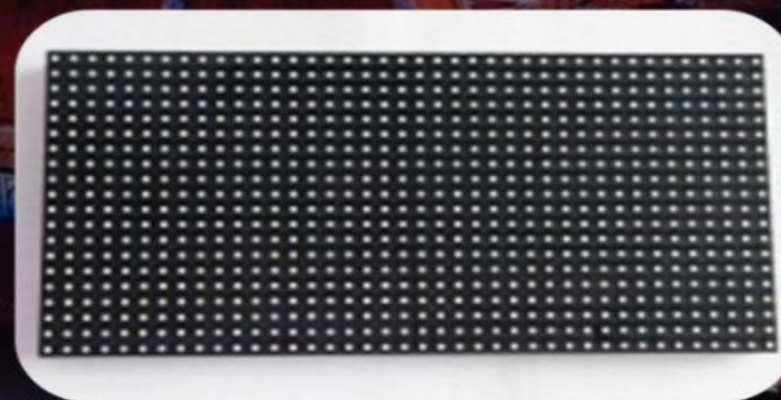
РИС. 3. ВИД МОДУЛЯ P8 ММ.