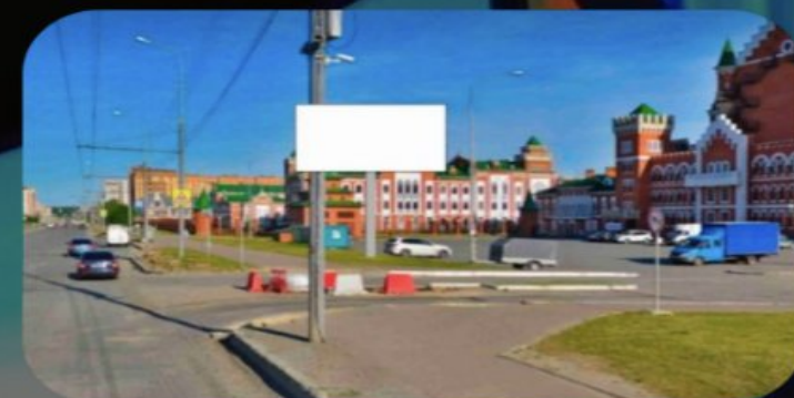
РИС. 2 СВЕТОДИОДНЫЙ ЭКРАН УЛИЧНЫЙ 5760X2880ММ P8 ММ. ВИД С ОСНОВНОЙ СТОРОНЫ ЭКРАНА