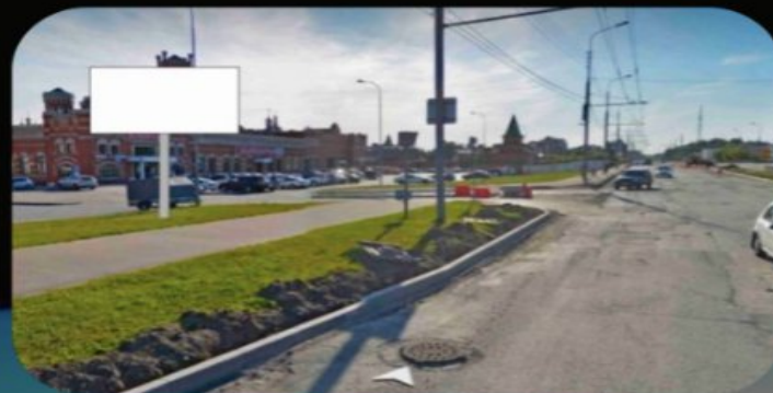
РИС. 1 СВЕТОДИОДНЫЙ ЭКРАН УЛИЧНЫЙ 5760X2880ММ P8 ММ. ВИД С ЗАДНЕЙ СТОРОНЫ ЭКРАНА