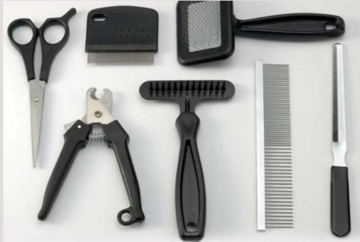
Инструменты для домашнего ухода за собакой