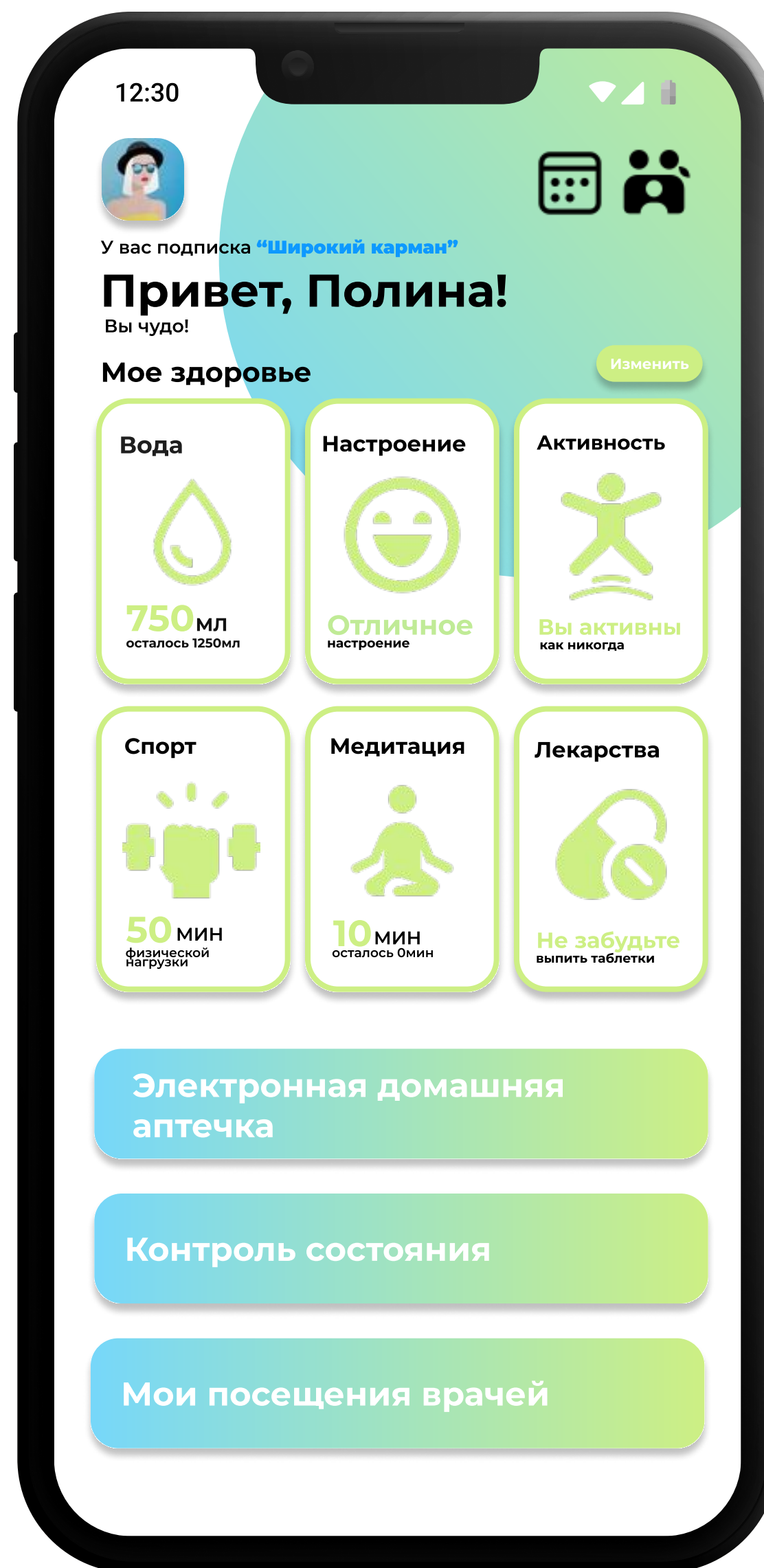
Видео работы продукта