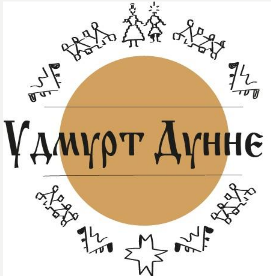
Примерный логотип игры