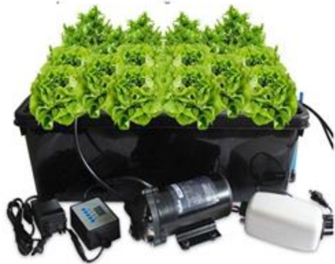
От китайских друзей