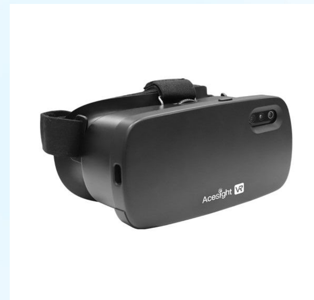
Электронные очки Acesight VR