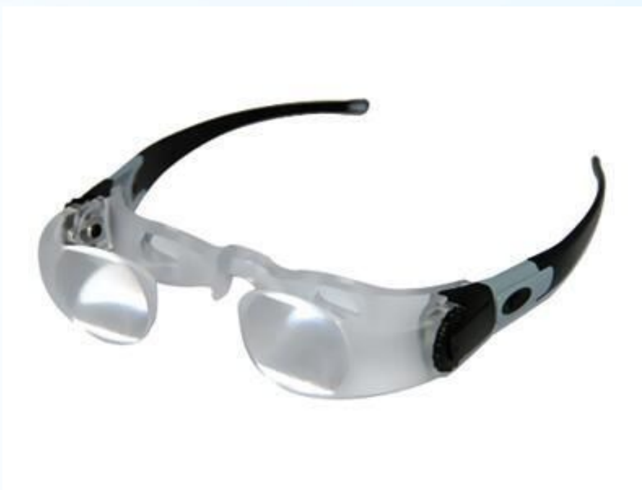
Биноклярные очки, корректирующие зрение Max-Detail 2x (Германия)