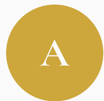
ТАБЛИЦА УЧЁТА СТЕЙКХОЛДЕРОВ