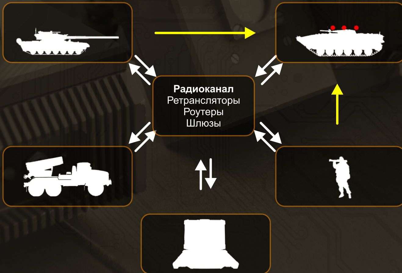
СХЕМА РАБОТЫ КОМПЛЕКСА