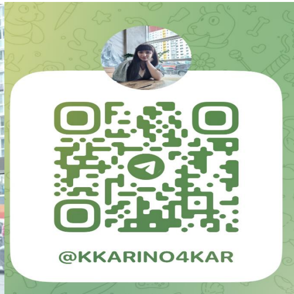
ФОТО И КОНТАКТЫ