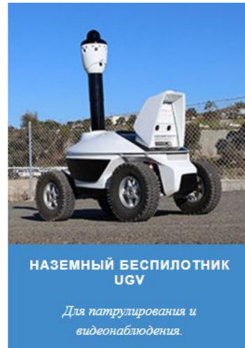
НАЗЕМНЫЙ БЕСПИЛОТНИК UGV