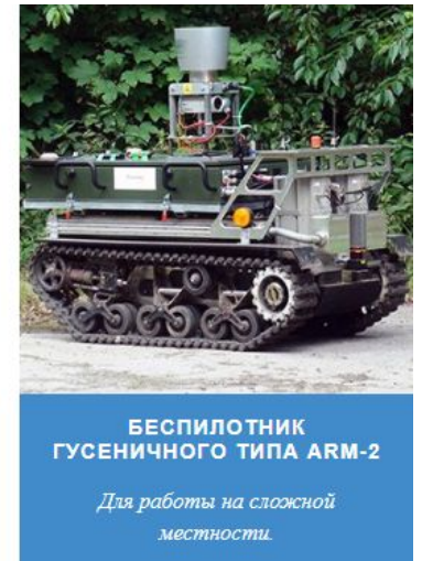
БЕСПИЛОТНИК ГУСЕНИЧНОГО ТИПА ARM-2