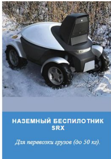
НАЗЕМНЫЙ БЕСПИЛОТНИК SRX