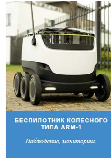
БЕСПИЛОТНИК КОЛЕСНОГО ТИПА ARM-1