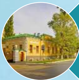
Дворец Александра 1