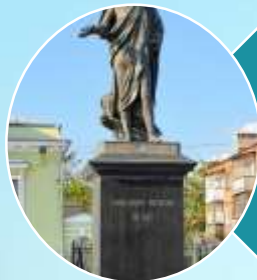
Памятник Александру 1