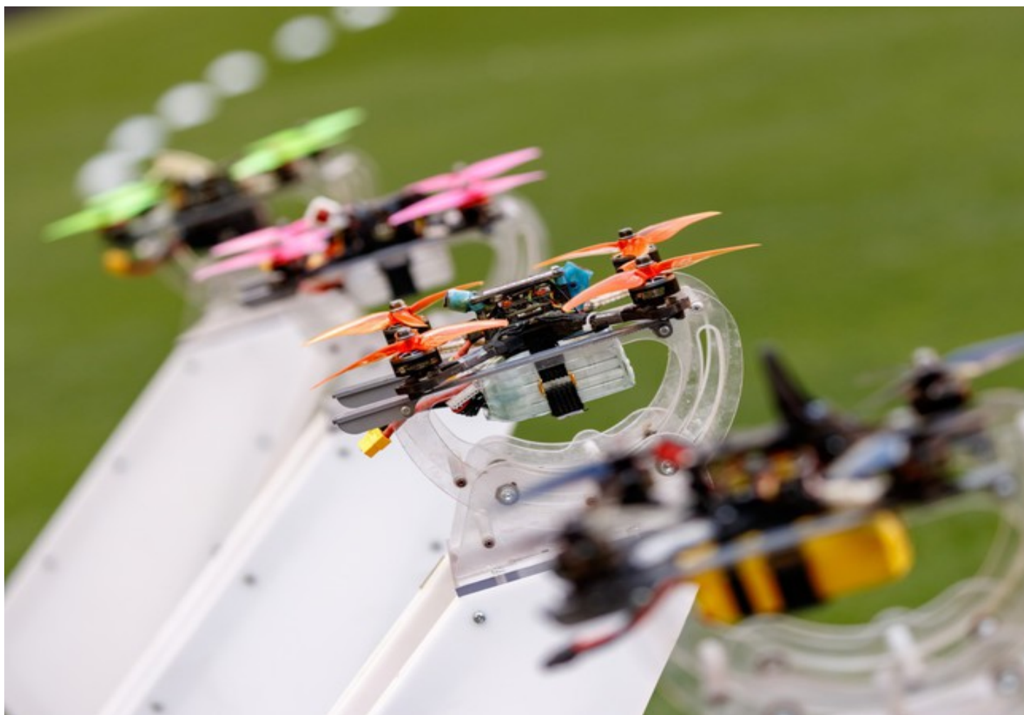
Минспорт РФ признал лазерный бой и гонки дронов видами спорта

В ведомстве также признали видами спорта брейкинг, многоборье ГТО и воздушную гимнастику. Все упомянутые дисциплины включены в первый раздел, в который входят виды спорта, не являющиеся национальными, военно-прикладными и служебно-прикладными, а также видами спорта, развитие которых осуществляется на общероссийском уровне.