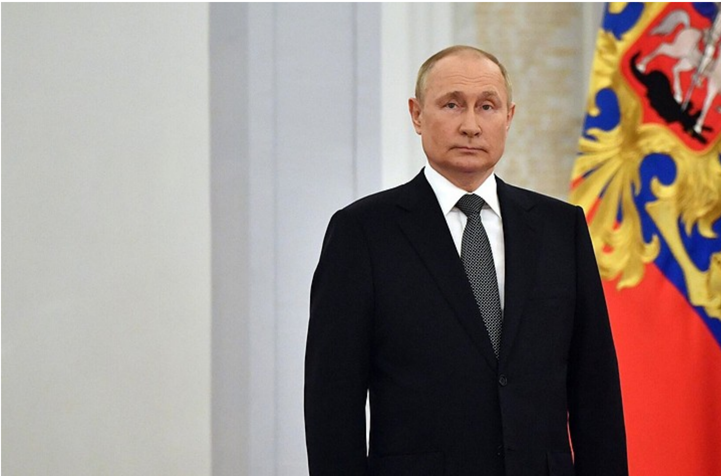
Президент РФ Владимир Путин

Минтранс должен представить свои предложения по этому поводу до 15 июля 2023 года, Правительство РФ — подготовить свои предложения до 1 сентября 2023-го. Также до 1 сентября 2023 года Правительству поручено подготовить предложения по противодействию противоправному применению беспилотников.