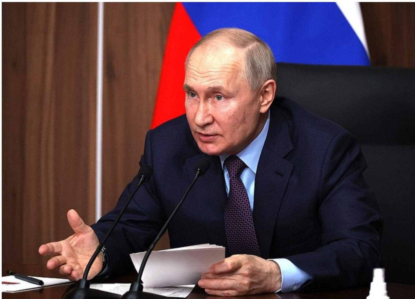
Владимир Путин в ходе совещания по вопросам развития беспилотных авиационных систем

Президент РФ Владимир Путин 27 апреля 2023 года в режиме видеоконференции провёл совещание по развитию беспилотной авиации в России. В ходе мероприятия были названы проблемы отрасли, озвучены основные цели использования беспилотников и определены задачи развития беспилотной авиации в стране.