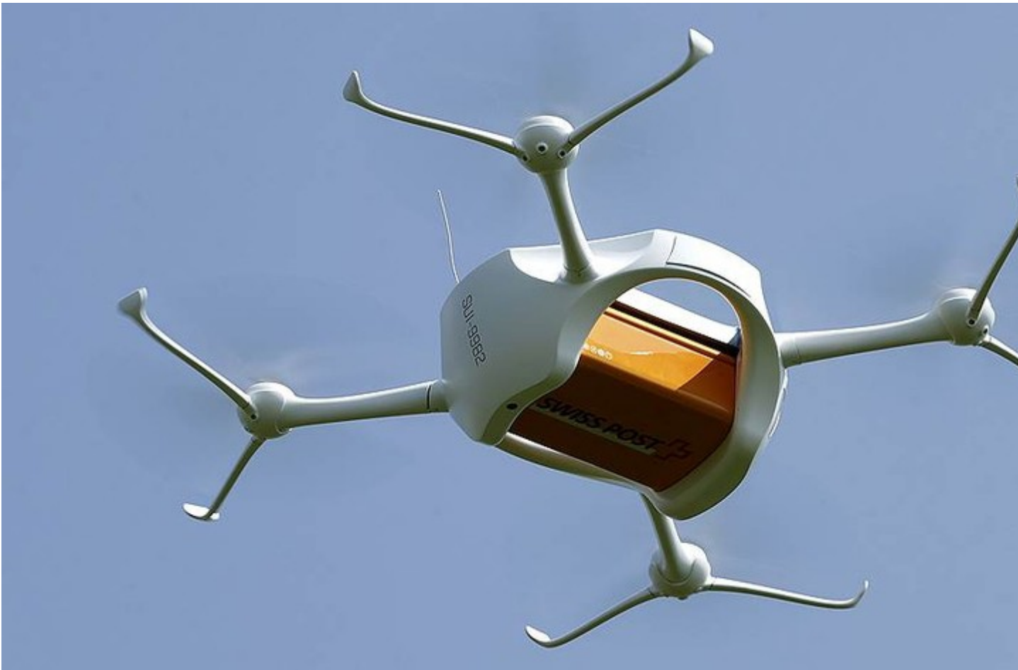
Беспилотный летательный аппарат

С помощью наземной инфраструктуры можно будет в режиме реального времени принимать, обрабатывать и распространять информацию о местоположении, маршруте и параметрах полета тысяч беспилотных авиационных систем над территорией России. Маршрут выстраивается автоматически по заявке оператора летательного аппарата.