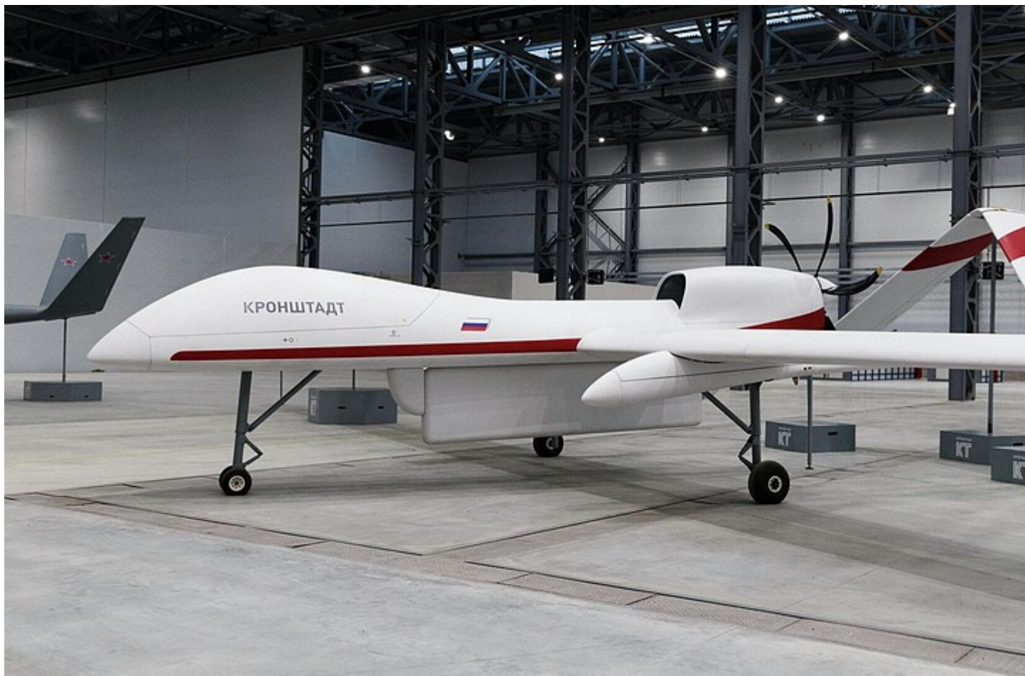
БПЛА от Кронштадт

В числе этих беспилотников указана линейка мультироторных аппаратов, это гоночные модели для спорта, коммерческие модели для ведения аэрофотосъемки и распространения агрохимикатов, сказал Бабинцев в беседе с «Газета.ру».